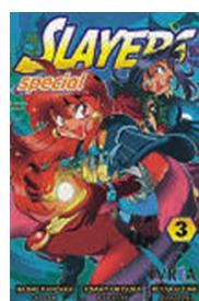
SLAYERS (スレイヤーズ sureiyāzu)

Tots els éssers vius emeten una energia que sorgeix de les emocions negatives i aquestes emocions incontrolables creen malediccions. A Jujutsu Kaisen tots els estudiants per a mag com la Nobara kugisaki són els únics que poden controlar aquest tipus de corrent i utilitzar-la per lluitar contra aquests conjurs. La Nobara és el personatge més decidit i obstinat entre seus companys i rebutja els rols de gènere tradicionals per tal d'estimar-se tal com es.