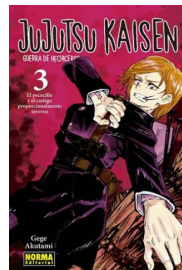
JUJUTSU KAISEN (呪術廻戦)

Mangues destacats amb personatges femenins que ens han captivat per la seva força, intel·ligència i determinació davant l'adversitat.