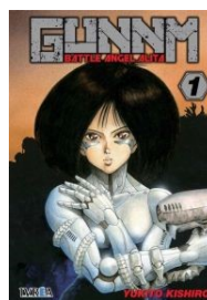
Battle angel Alita (銃夢 GUNNM)

Lina Inverse és la protagonista d'aquesta història de màgia, batalles èpiques i comèdia. Aquest manga narra les aventures d'una bruixa adolescent de gran cor i valentia però una mica acomplexada, que lluitarà amb tot el seu coratge per acabar amb les forces del mal. És coneguda al seu gremi per ser una de les bruixes més poderoses i temibles del món i controla a la perfecció la màgia negra.